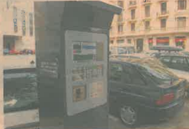
En 2018 se reducirá el número de plazas de zona azul.

Bimsa, otra empresa municipal, tiene presupuestadas inversiones por 101 millones (-25%)